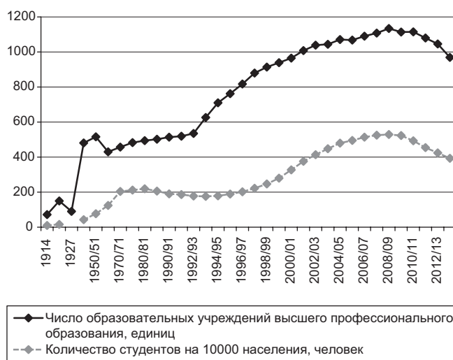
Рис. 2. Динамика числа образовательных учреждений высшего профессионального образования и количества студентов на 10000 населения

Следует отметить, что с начала XX века заметно возросла роль высшего профессионального образования. В 1914 г. насчитывалось 72 учебных заведения высшего профессионального образования, в которых обучалось 865 тыс. человек (см. рис. 2). В 1927 г. данный показатель снизился по сравнению с 1917 г. на 40%, после чего последовал рост вплоть до 1950 г. К 1960/61 учебному году число образовательных учреждений высшего профессионального образования снизилось по сравнению с 1950/51 учебным годом на 16,7% и составило 516 единиц. В последующие годы наблюдался устойчивый рост исследуемого показателя вплоть до 2004/05 учебного года. В настоящее время отмечается тенденция к снижению числа образовательных учреждений высшего профессионального образования. Аналогичная тенденция наметилась начиная с 2008 г. по показателю «количество студентов на 10000 населения».