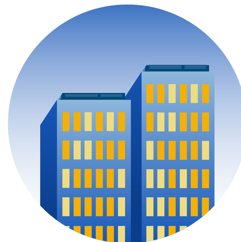
Организации оптовой торговли